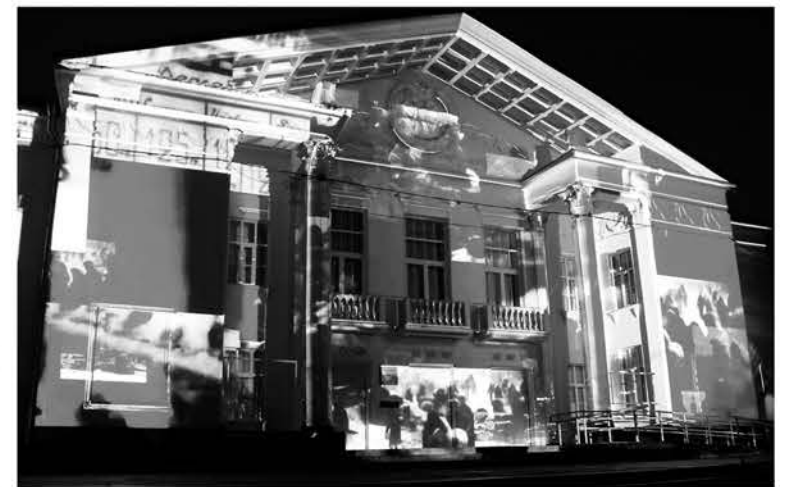
Показ лазерных проекций на стенах Дворца культуры

Сюжет состоял из трёх эпизодов: хроника блокады Ленинграда, операция «Искра», память о Великой Победе. Это были двадцать минут сильных эмоций: трепет и страх, тревога