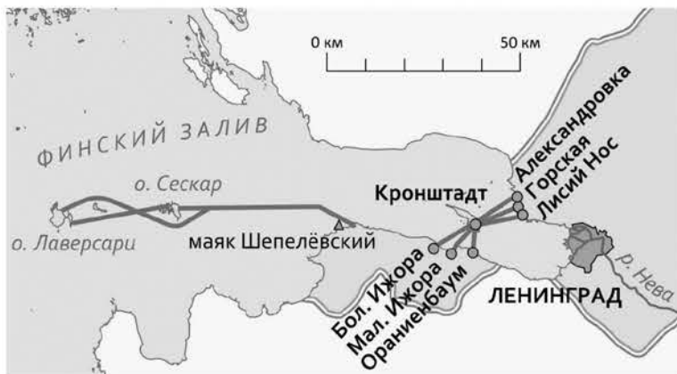
Маршрут Малой Дороги жизни на карте

ПРЕЗИДЕНТ РОССИИ ВЛАДИМИР ПУТИН ПОДДЕРЖАЛ ИДЕЮ ЛЕНИНГРАДСКИХ АКТИВИСТОВ ПО ВОССТАНОВЛЕНИЮ МАЛОЙ ДОРОГИ ЖИЗНИ