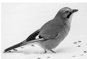
Сойка лакомится семенами

— В лесу большой удачей можно считать встречу с кукушкой.