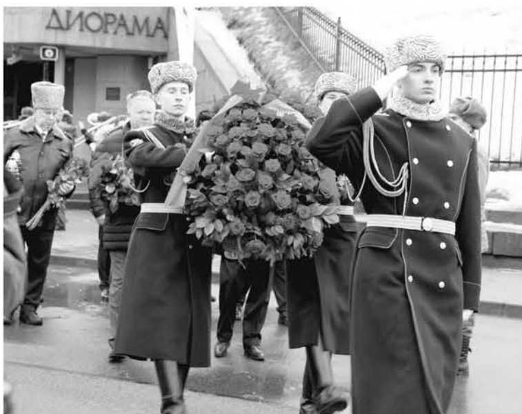
Возложение цветов ротой почётного караула

Видео «Лазерная проекция на фасаде Дворца культуры в память 80-летия прорыва блокады Ленинграда»