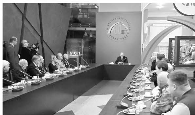
Владимир Путин встретился с ветеранами и жителями блокадного Ленинграда

В годы войны информация об этом маршруте была засекречена. Поэтому до сих пор исто-