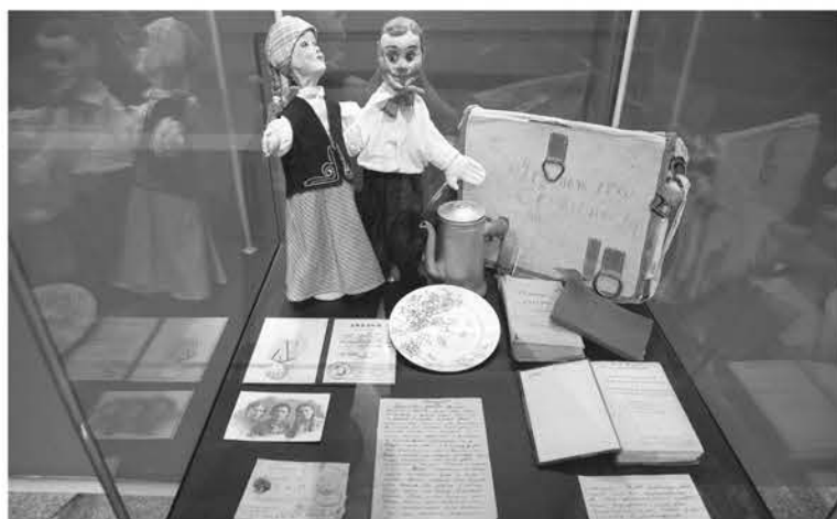
Выставка «Искра надежды» собрала экспонаты со всей страны

АЛЕКСЕЙ АСТАПЧИК ФОТО: ПРАВИТЕЛЬСТВО ЛЕНИНГРАДСКОЙ ОБЛАСТИ