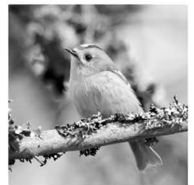
«Северный колибри» — желтоголовый корольёк

— Помогает ли пернатым программа создания заказников и заповедников в Ленинградской области? Например, в вопросе сохранения краснокнижных видов птиц?