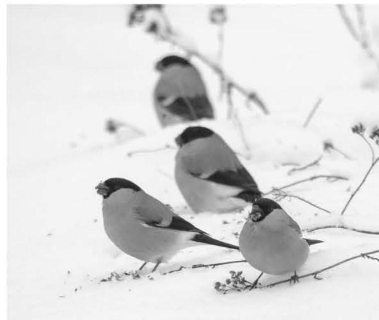
Снегири в Нижне-Свирском заповеднике

В УСЛОВИЯХ ПЕРЕМЕНЧИВОЙ ЗИМЫ ПЕРНАТЫМ ОСОБЕННО НУЖНА ПОМОЩЬ ЧЕЛОВЕКА