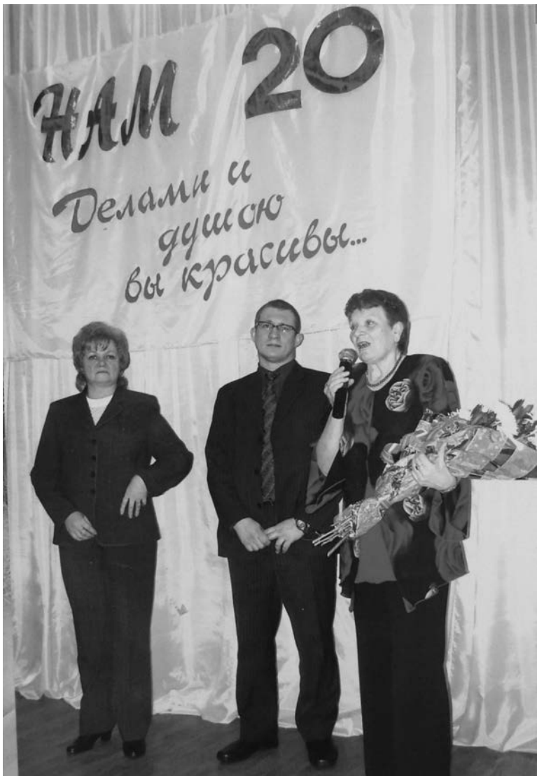
На празднике, посвящённом 20-летию юбилею общественной организации ветеранов города Пикалёво, 2008 год