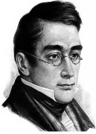
Александр Грибоедов (15.01.1795 – 30.01.1829)