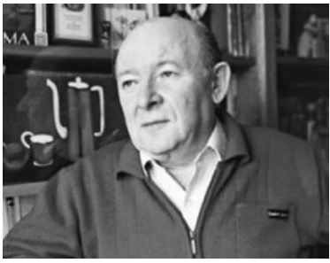
Константин Ваншенкин (17.12.1925 – 15.12.2012)