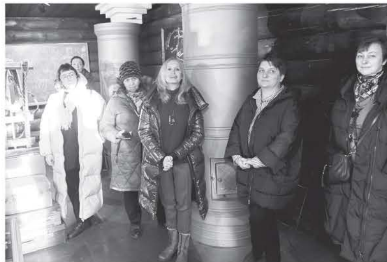
Экскурсии по новой экспозиции расписаны на месяц вперёд