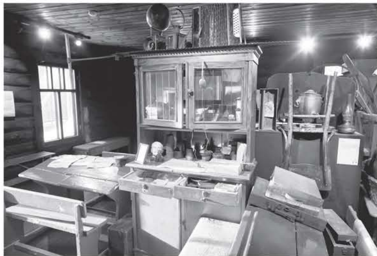
Школьные парты, мебель и старый самовар – все эти вещи из 40-х годов хранят свою память о событиях военных лет

ОТКРЫТЫЙ ПОСЛЕ РЕКОНСТРУКЦИИ МУЗЕЙ «АСТРАЧА, 1941» ЖДЁТ ГОСТЕЙ НА НОВУЮ ЭКСПОЗИЦИЮ О ВЕЛИКОЙ ОТЕЧЕСТВЕННОЙ ВОЙНЕ