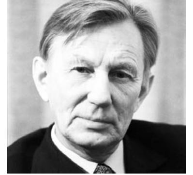
Михаил Дудин (20.11.1916 – 31.12.1993)

- Когда вверх тормашками катится И бьётся в паучей судьба, Не надо молиться и каяться, Бояться сумы и суда. - Оглядывая пристальной прошлое, Без лести оценивай дни, Окурки иллюзий – подошвою! А светлomu – грудь распахни! - Не сдайся бессилью и горечи, Не дайся неверью и лжи – Не все лизоблюды и сволочи, Не все стукачи и ханжи. - Шагая дорогами чуждыми В какой-то неведомый край, Друзей имена, как жемчужины, Как чётки перебирай. - Будь зорким, весёлым и яростным И выстоишь, выстоишь ты Под грузом невзгод многоярусным, Под ношей твоей правоты.