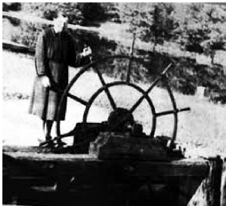
На Тамбовском шлюзе, 1950-е годы