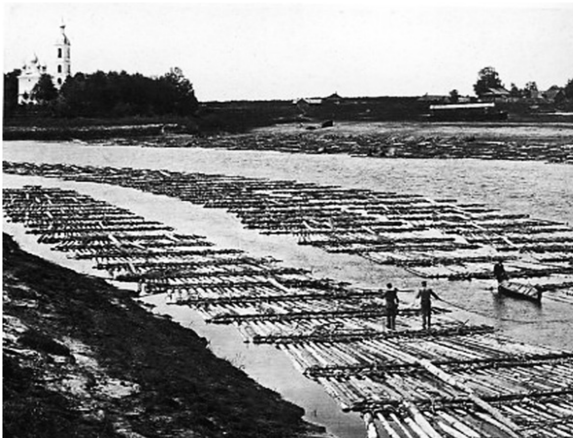
Сплав плотов по реке Мологе

«Возьми свои червонцы; Я не лучше работал других мастеровых, заплати Мне то, что ты обыкновенно платишь другим мастерам, на то куплю Я новые башмаки, которые опять протоптались; взял 18 алтын, поехал в ряды и купил на них в самом деле новые башмаки, которые Он имея на ногах часто показывал в собраниях, и притом обыкновенно говаривал: Я их сам мозолью выработал».