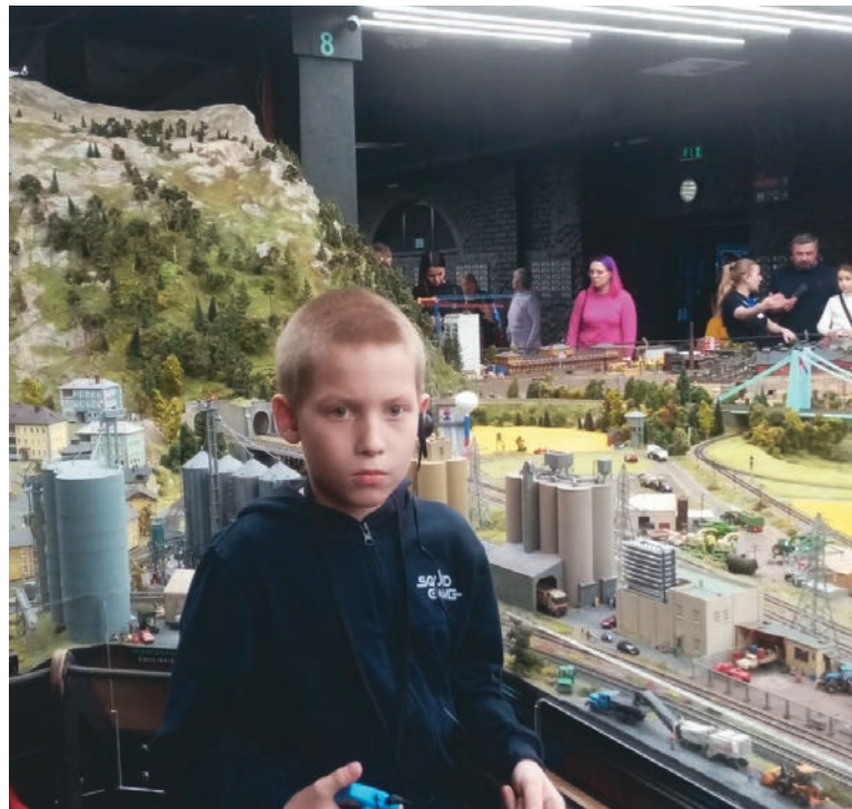
Страницы подготовила Карина Шишкина

Впечатления от поездки надолго запомнятся каждому участнику путешествия. Спасибо родителям ребят, которые нашли возможность дать детям столько положительных эмоций.