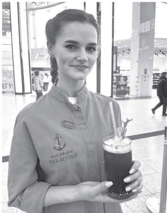
Все блюда на конкурсе были приготовлены из продуктов, выращенных в регионе

ным образованием – одна из важных задач, стоящих перед областью.