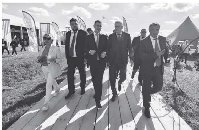
Мероприятие посетили министр сельского хозяйства РФ Дмитрий Патрушев (в центре) и губернатор Ленобласти Александр Дрозденко

Машины двигались по пашне неспешно, уверенно, работали с ювелирной точностью. Залог успеха здесь не сила и скорость, а качество и расчёт. Одним словом – искусство!