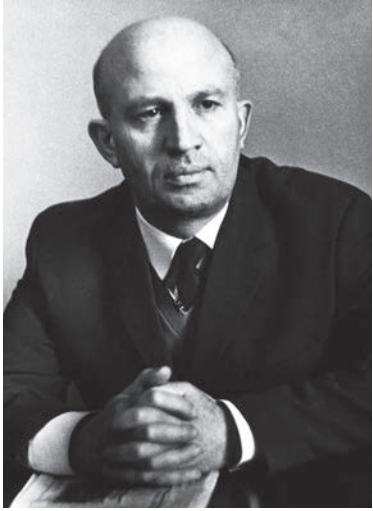
Грыгол Абашидзе (1.08.1914 – 29.07.1994)