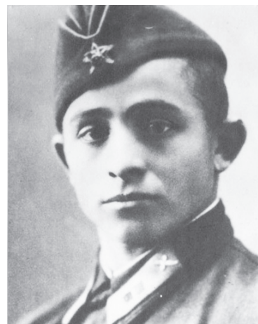
Борис Корнилов (29.07.1907 – 20.02.1938)