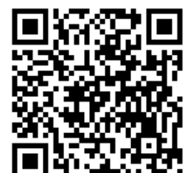
Торжественное открытие ярмарки