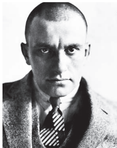
Владимир Маяковский (19.07.1893 – 14.04.1929)