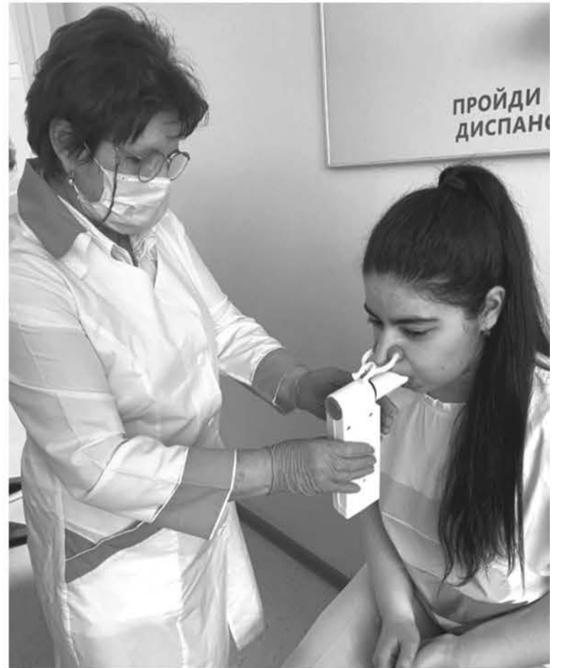
Спирометрия позволяет оценить состояние лёгких после коронавируса

– А как обстоят дела с диспансеризацией? Она ведь особенно важна для перенёсших COVID-19?