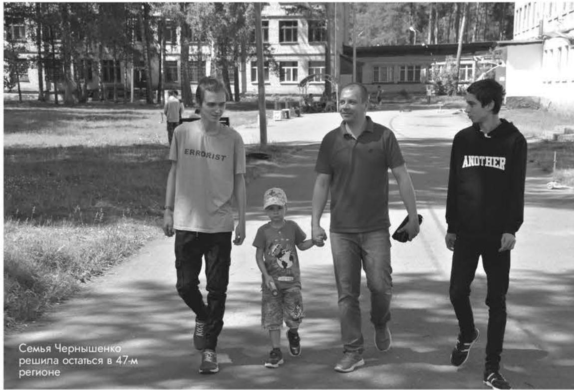
Семья Чернышенко решила остаться в 47-м регионе

– ПВР в Тихвинском районе – образец взаимодействия го-