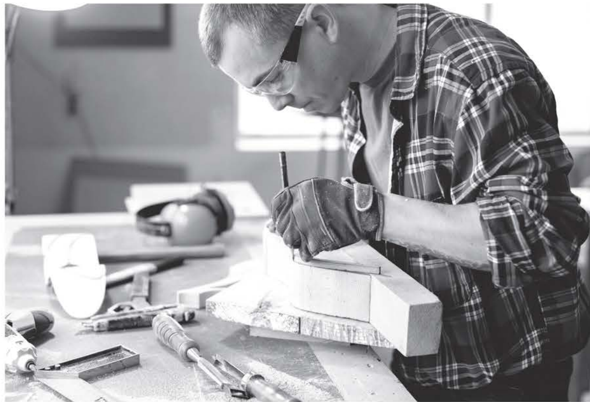
Деньги, полученные по соцконтракту на своё дело, можно потратить на приобретение оборудования, инструментов, оргтехники, расходных материалов, на аренду помещения...

По направлению «поиск работы» гражданину необходимо зарегистрироваться в Центре занятости населения и получить статус безработного или ищущего работу. При заключении соцконтракта ему выплатят 15 324 рубля в первый месяц поиска работы, и при трудоустройстве это пособие будут платить ещё три месяца. Также можно рассчитывать на единовременную выплату на курс обучения в