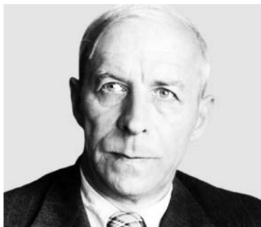
Николай Асеев (10.07.1889 – 16.07.1963)

- Мне сказали, что ты умерла Заодно с золотым листопадом И теперь, лучезарно светла, Правишь горным, неведомым градом. - Я негде забыть готов, Ты всегда баснословной казалась И багрянцем осенних листов Не однажды со мной любовалась. - Говорят, что не стало тебя, Но любви иссякаемы ль струи: Разве зори - не ласка твоя, И лучи - не твои поцелуи?