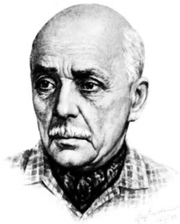
Павел Антокольский (01.07.1896 – 09.10.1978)