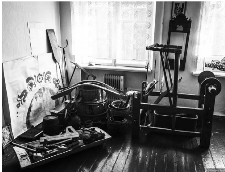
Музей истории и культуры села Сомино