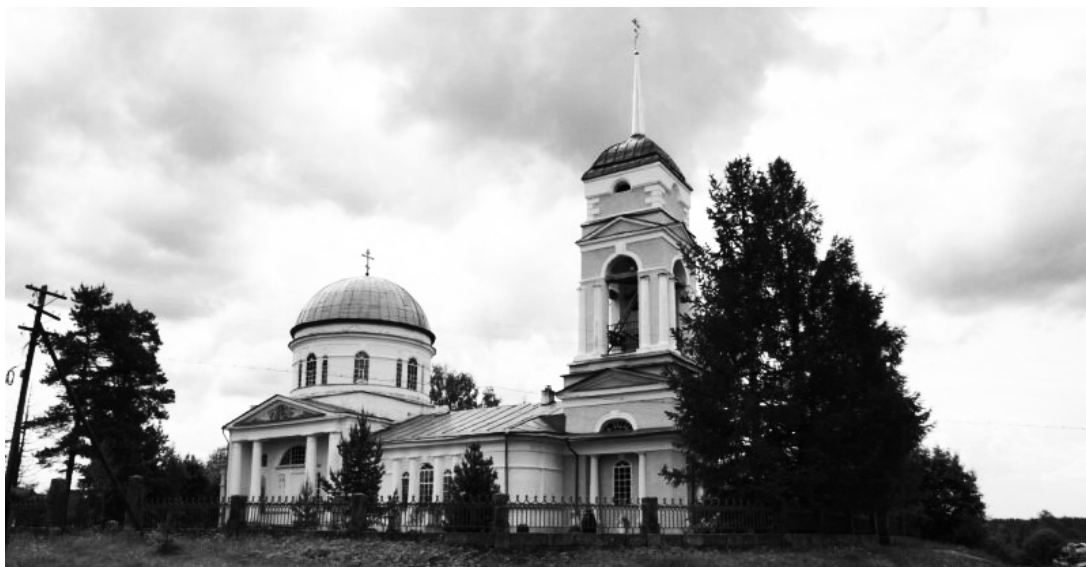
Храм Петра и Павла

Так почему же Сомино называют «малым Петербургом»? Все очень просто! Шпиль Петропавловской церкви венчает фигура ангела, которая в точности повторяет очертания ангела на шпиле Петропавловского собора в Санкт-Петербурге, отличие только в размерах, отсюда и нехитрое название – «малый Петербург».