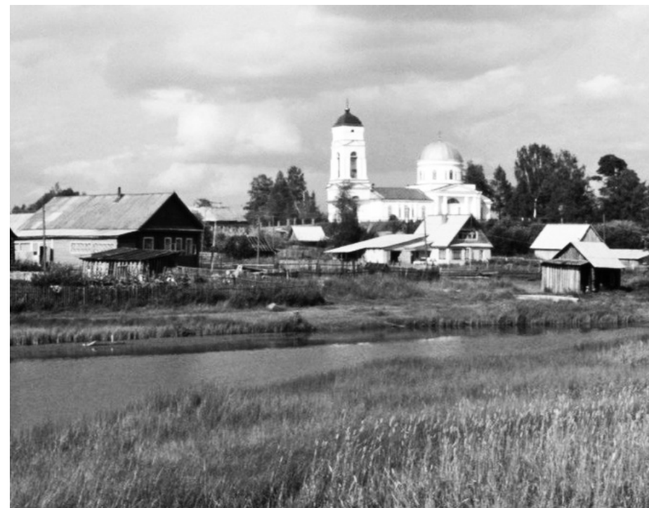
Вид на реку Соминку и Храм Петра и Павла

У соминцев бытует предание, что река и само село получили свое название от слова «сом», который якобы водился в здешней реке. Легенда гласит: когда-то эту рыбу огромных размеров поймал сам Петр I, и пристань, где это произошло, назвали в честь такого знаменательного события. Существует и другая версия: название имеет вепские корни. Слово «Самау», «самал» — обозначают мох, а производное от него название реки Соминка — болотная, моховая река. Какая из версий ближе к истине, историки не определили до сих пор.