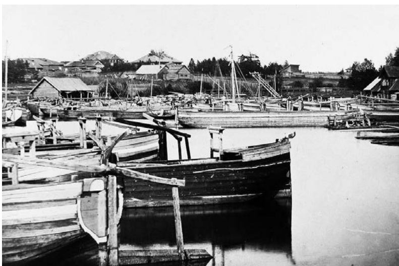
Вид с моста на соминскую пристань, фото XX века

Еще до приезда Петра I на эти земли, с XV столетия через Сомино проходил знаменитый путь «Из варяг в греки», что сыграло немалую роль в экономическом развитии всего края.