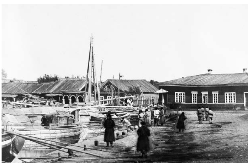
Местные жители у дома начальника дистанции на Соминской пристани, фото XX века