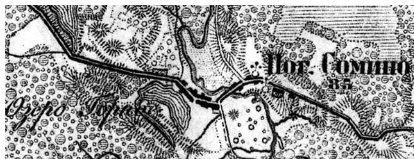
Сомино на карте 1917 года

Продолжая наше путешествие и двигаясь дальше по следам Петра I, мы попадаем с вами в село Сомино или как его еще называют - «малый Петербург» или «восточные ворота Ленинградской области». Находится это старинное купеческое село почти в 50-ти километрах от нашего с вами родного города Пикалево и является достаточно удаленным населенным пунктом региона, поэтому приехать сюда захочет не всякий. И очень зря! Ведь Сомино – это кладезь интересных мест, исторических памятников и живописных видов. Но обо всем по порядку.