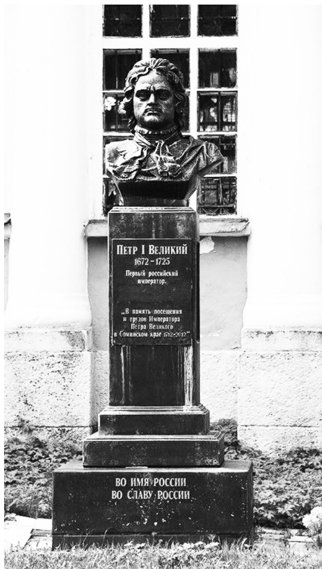
Памятник Петру I