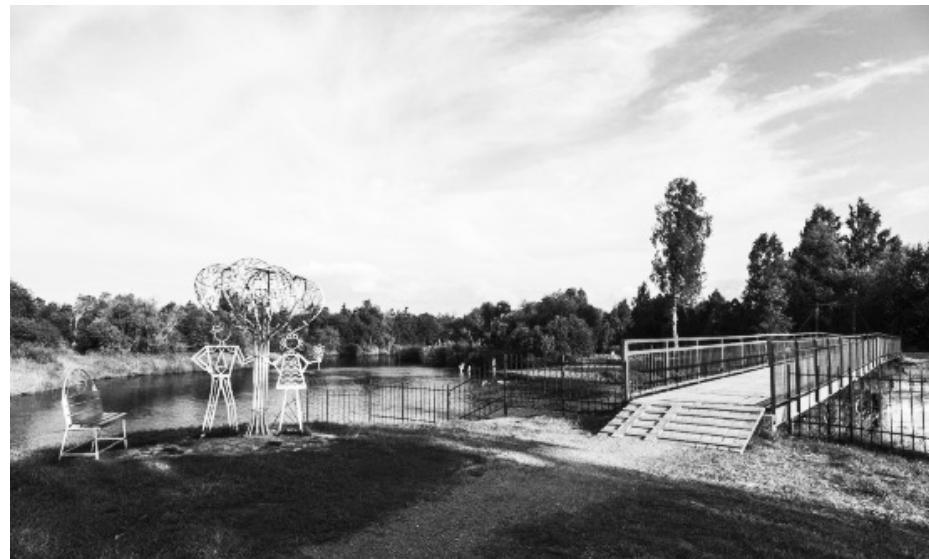
Вид на пешеходный мост и «Дерево любви»

Детство Петра Великого наполнено разными интересными фактами и историями. С ранних лет он очень любил всевозможные подвижные игры, которым уделял большую часть своего досуга. При этом он иногда на целые сутки отказывался от еды.