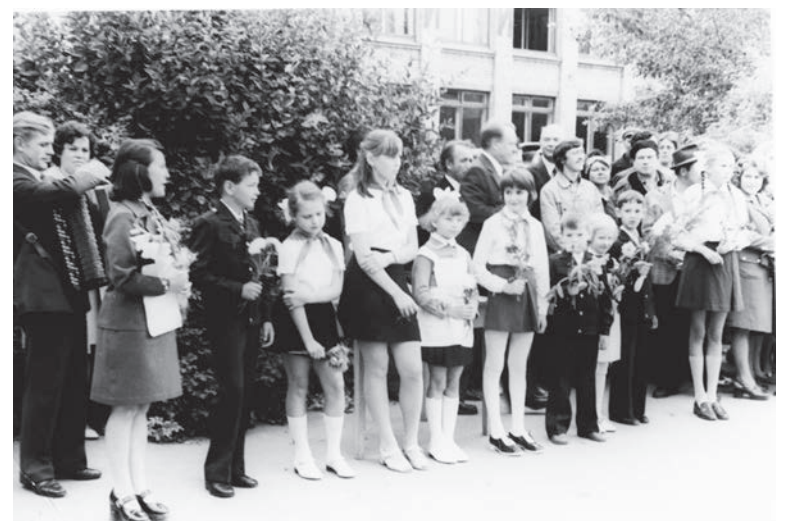
Линейка 1976г. День знаний.