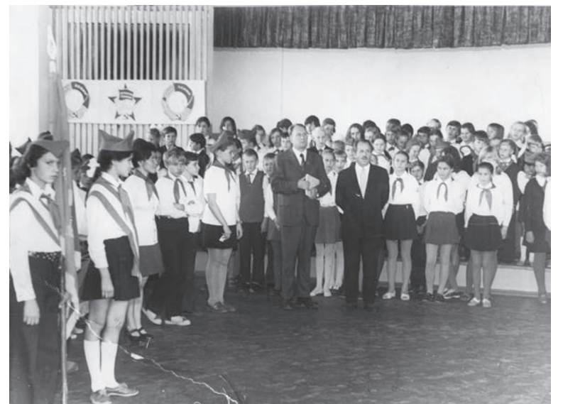
Дружинный сбор. Школа №4. 1975г.