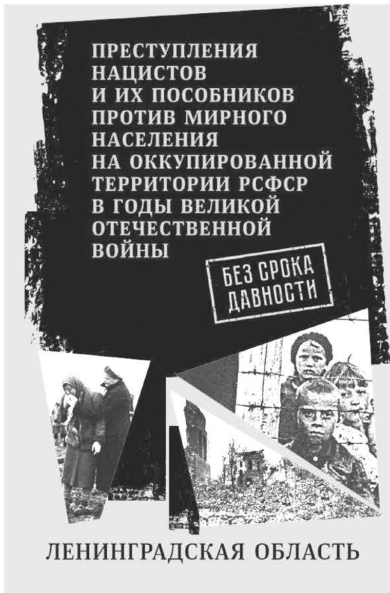
Часть выставки посвящена крупнейшим международным процессам, связанным с судом над нацистскими преступниками и их пособниками