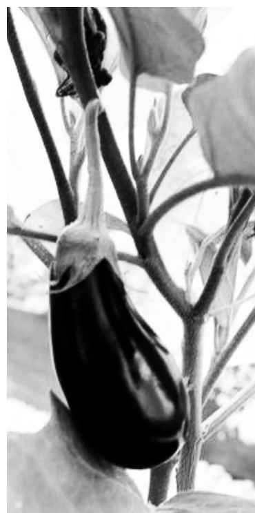
Страницу подготовила Карина Шишикина