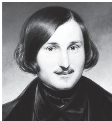
Николай Гоголь (01.04.1809 - 04.03.1852)