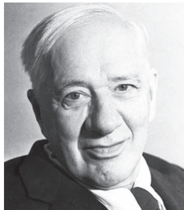
Корней Чуковский (31.03.1882 - 28.10.1969)