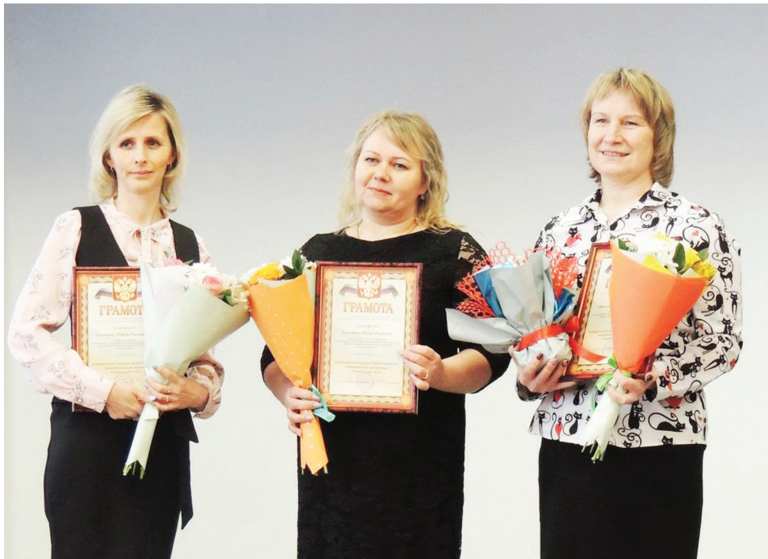
Фото -рубрика на страницах газеты

3 февраля в Бокситогорской школе №1 состоялся финал районного конкурса «Учитель года».