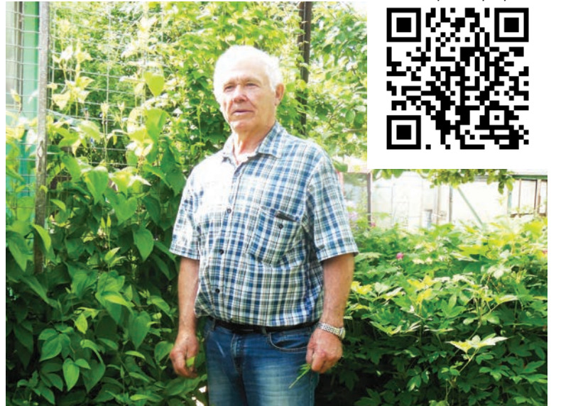
Альбом с фотографиями

Зато был азарт и огромное желание: все должно получиться! За эти годы участок, на котором раньше только выращивались овощи и ягоды, стал настоящим оазисом: благоухают пышные пионы и розы, распустились лилии и дельфиниумы, флоксы и горензии; появилась уютная полянка с качелями, обрамленная кле-