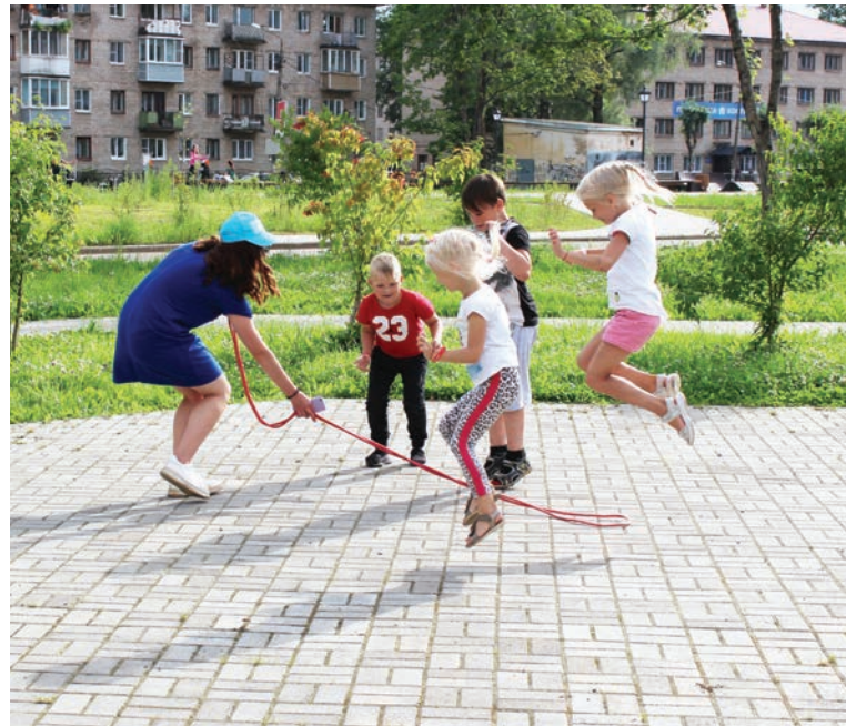
Фото: Дворец Культуры города Пикалево