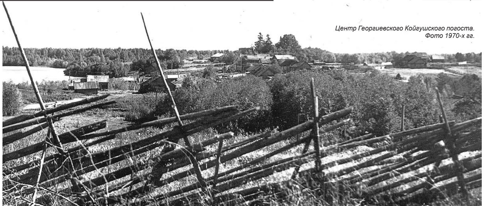
Центр Георгиевского Койгушского погоста. Фото 1970-х гг.

В исторической науке принято, что все населённые пункты ведут своё летоисчисление от первого упоминания их в письменных источниках. Климентский Колбекский погост (Колбаский) упомянут в новгородской второй Софийской летописи под 1477 годом, когда он был изъят из собственности новгородского Софийского Дома (новгородского архиепископа) в собствен-