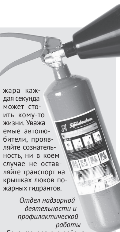
Отдел надзорной деятельности и профилактической работы Бокситогорского района.

Ещё один вопрос – это обеспечение беспрепятственного подъезда пожарной и специальной техники к жилым домам в случае возникновения чрезвычайной ситуации. Из-за личного автотранспорта, оставленного в проездах удомов, подъехать к месту пожара бывает невозможно. Это обстоятельство, в свою очередь, влияет на развитие пожара, существенно затрудняет тушение, проведение спасательных работ, а ведь во время по-