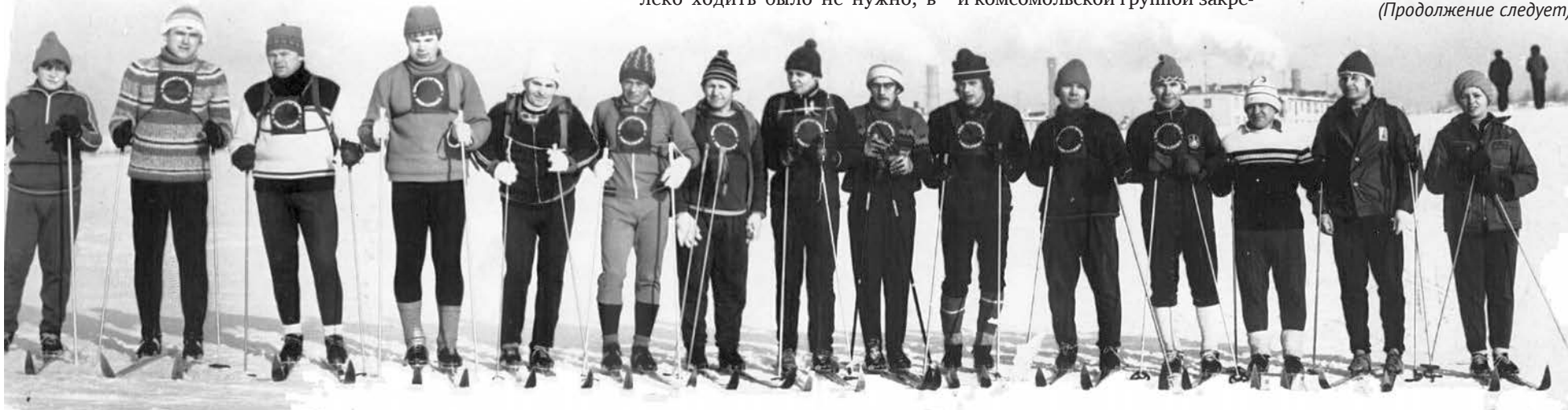
Участники традиционного лыжного пробега Пикалёво-Бокситогорск, посвящённого Международному женскому дню 8-е марта