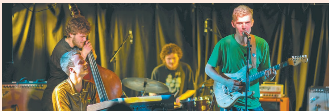
Bangin' Bülows Nice Jazz Quartet (Дания)