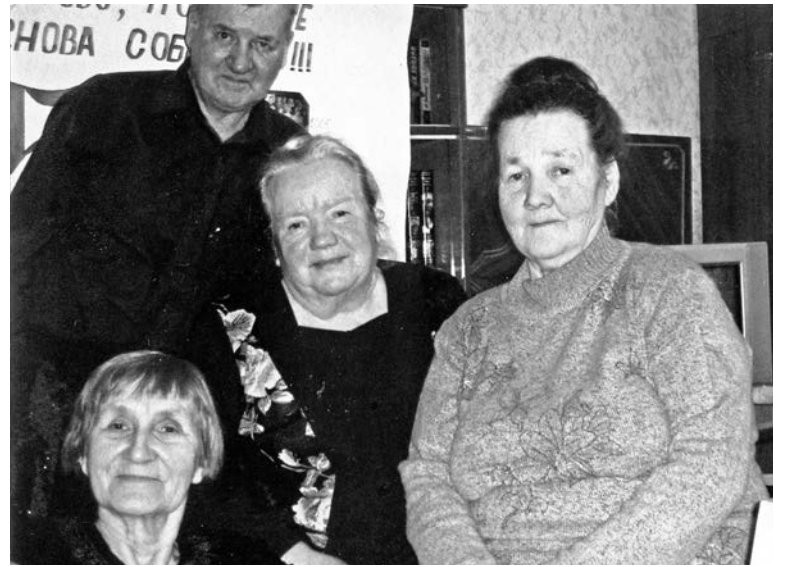
На встрече с одноклассниками в Тихвине, 2004 г.