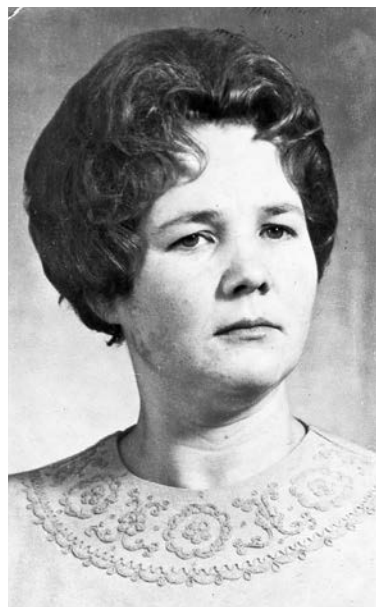
Вступление в партию, 1975 г.