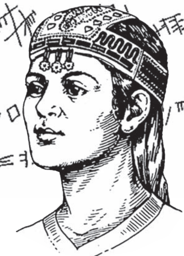
Фатьяновка. Реставрация облика по методу М.М. Герасимова

Не исключено, что фатьяновские племена сами были настоящими разбойниками для местных племён и совершали далёкие походы