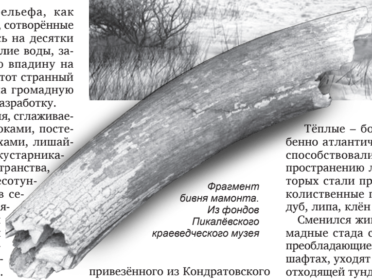
Фрагмент бивня мамонта. Из фондов Пикалёвского краеведческого музея