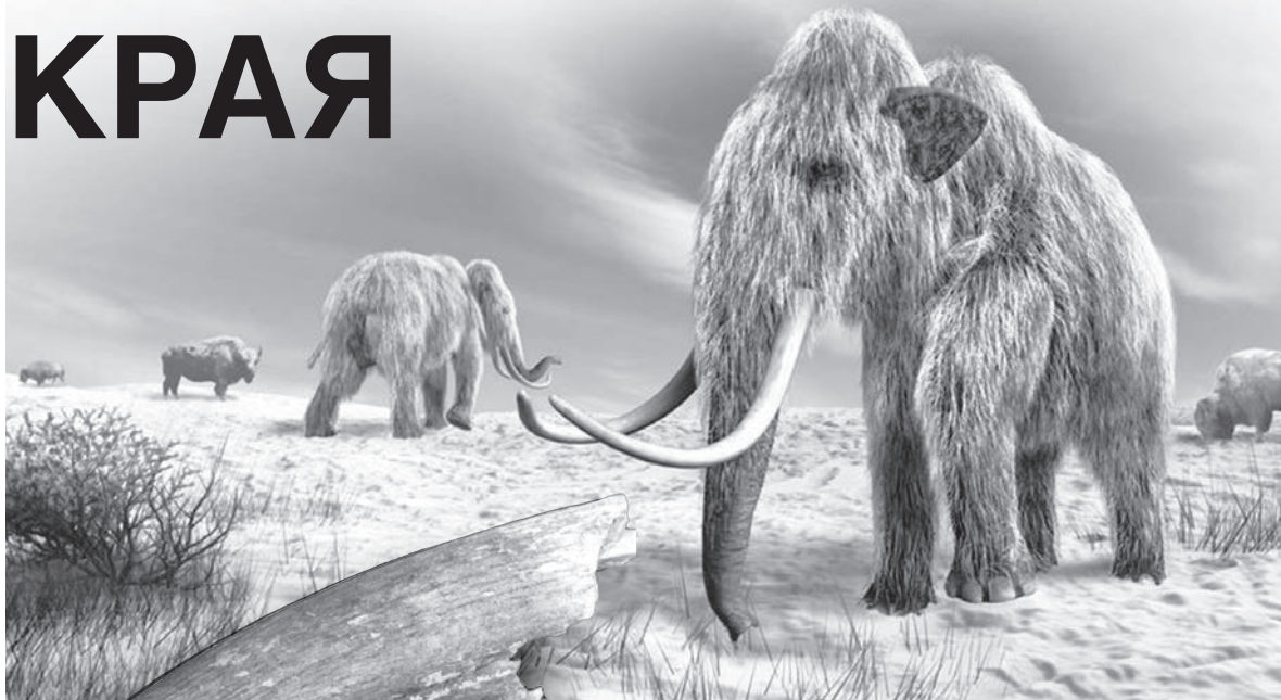
Животный мир древней тундры. Реконструкция.