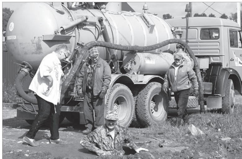
Аварийная бригада устраняет протечку на городских водопроводных сетях