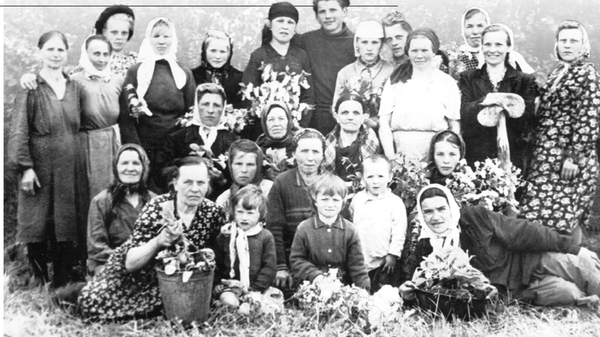
Бригада на посадке рассады капусты, д. Селиваново. 1954 г.

Существенную помощь местным колхозам в годы войны оказали механизаторы Большедворской машинотракторной станции (МТС). Работали они в сложнейших условиях. Трактористов-мужчин сменили женщины, у которых иногда просто не хватало сил прицепить к трактору тяжёлый плуг. Лучшие трактора были отправлены на фронт ещё в пору первой мобилизации 1941