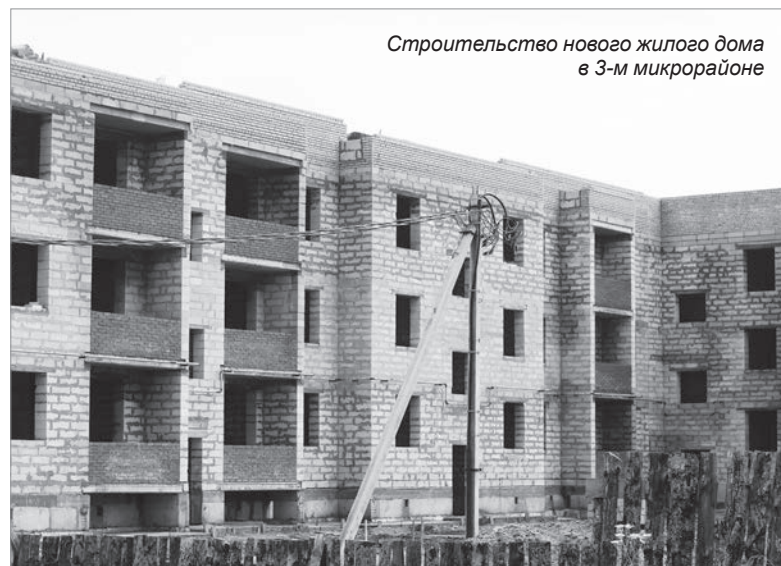
Строительство нового жилого дома в 3-м микрорайоне

Материал подготовлен по заказу комитета по печати и связям с общественностью Ленинградской области.