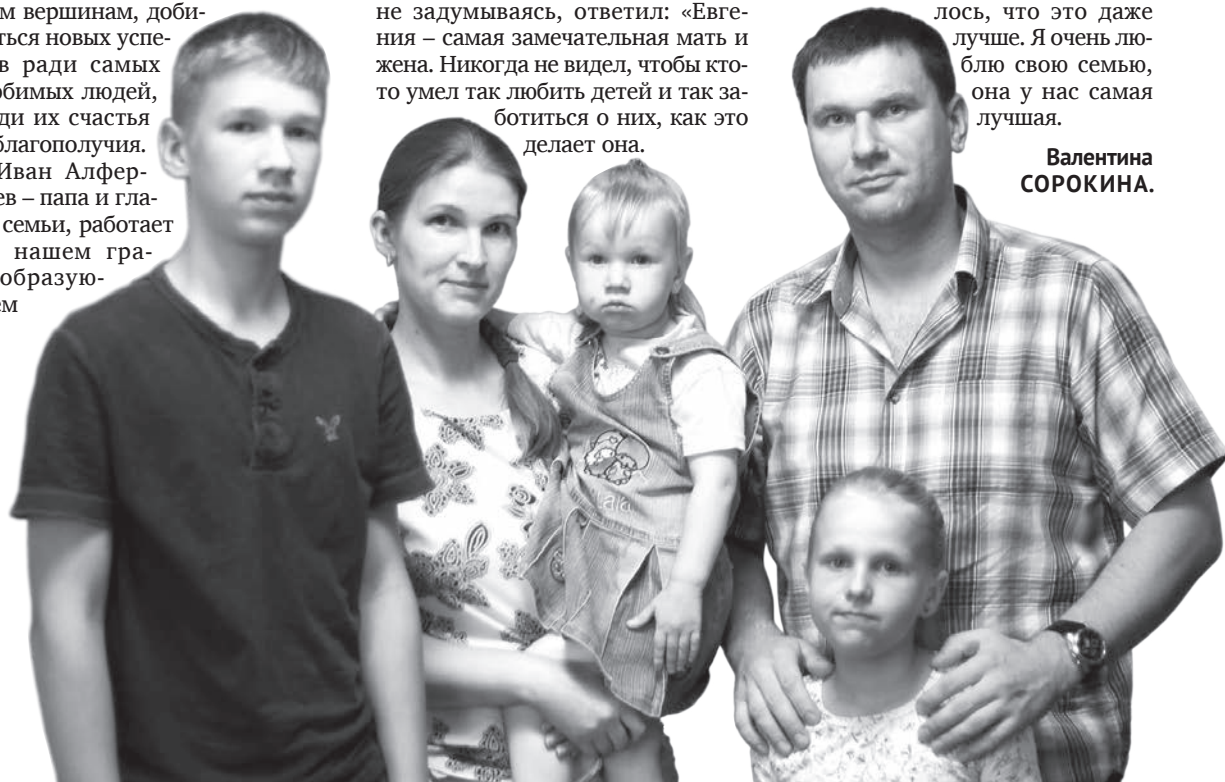
Материал подготовлен по заказу комитета по печати и связям с общественностью Ленинградской области.