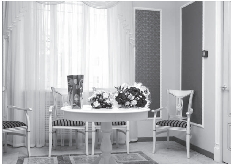
Интерьер ЗАГСа после ремонта

Берём кредиты в «Россельхозбанке», помогает нам и Фонд поддержки предпринимательства, который выдаёт микрозаймы. Много заказов от физических лиц, которые делают предоплату на покупку материалов, инструментов и