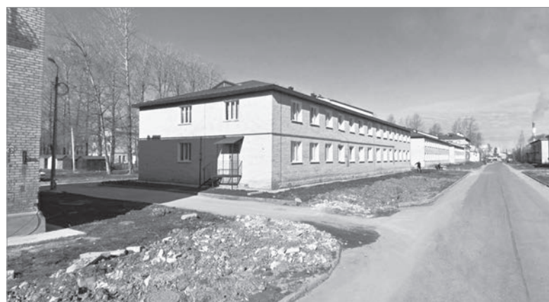
Пикалёво, ул. Строительная, д. 34

заявкам жителей. В доме №48 шестого микрорайона, например, отремонтировали общедомовые канализационные сети в четырёх подъездах, инженерные сети. Кроме жилых многоквартирных домов у нас на балансе есть отдельно стоящие здания, собственники которых заключили с компанией договоры на их техническое обслуживание. Это, в частности, судейский участок на Школьной, д. 67 в г. Пикалёво, в Бокситогорске судебный участок на ул. Воронина, д. 2 и типография на ул. Заводской, д. 22.