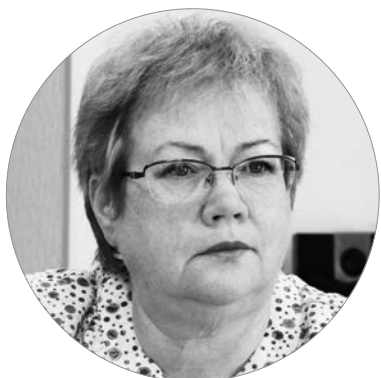
Екатерина Соловьёва, и.о. главы администрации МО «Город Пикалёво»