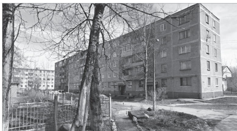
Пикалёво, 6-й микрорайон, д. 40

– Через две недели после отключения отопления начали подготовку к очередному отопительному сезону. (В соответствии с правилами подготовки и проведения отопительного сезона в ЛО, а также для комфортной жизни в зимнее время жителей многоквартирных домов.) Технические руководители хорошо знают ситуацию по каждому дому. Они составили план, в соответствии с которым готовим жилой фонд к зиме. Промываем системы отопления, делаем опрессовку системы отопления, ремонтируем кровли, подъезды, двери, окна. Но, разумеется, первоочередное внимание уделяется аварийным работам. Капитальным ремонтом не занимаемся, и деньги на эти цели с населения не собираем.