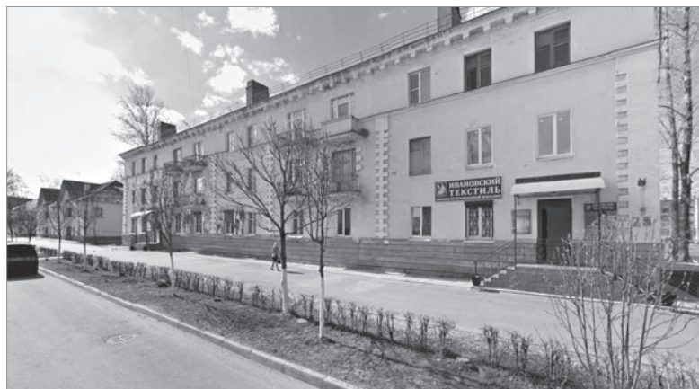
Пикалёво, ул. Советская, д. 28