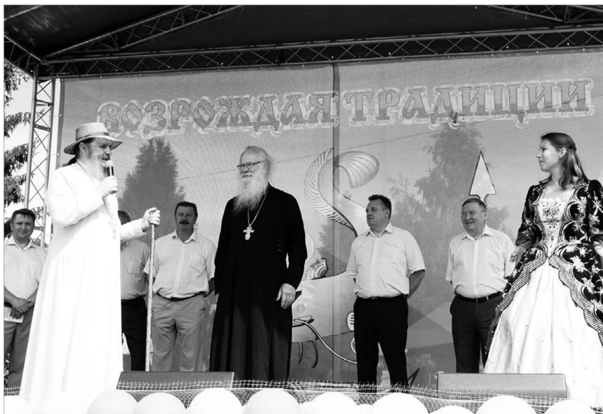
На Соминской Петровской ярмарке в селе Сомино Бокситогорского района.

И ещё мы вносим предложение: половина депутатов, а это 25 человек, будет получать заработную плату, а половина будет работать на общественных началах. Это сокращение расходов достаточно серьёзное и вполне ощутимое.