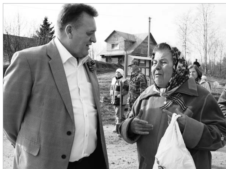
В садоводческом товариществе «Металлурга-1» Шибково, г. Пикалёво.

Опыт, приобретённый в правительстве области, сформировал определённые навыки, которые помогают строить свою работу так, чтобы города, сельские поселения Бокситогорского района попадали в различные государственные программы, так как сейчас, как правило, финансирование во всех направлениях ведётся именно через госпрограммы. Думаю, что к моему мнению прислушиваются. Если посмотреть на наши учреждения образования, спортивные сооружения – они в последние годы стали преобразоваться, и это не предел, в последующие годы финансирование станет ещё лучше. С одной стороны, есть возможность, а с другой – есть заинтересованность у руководите-