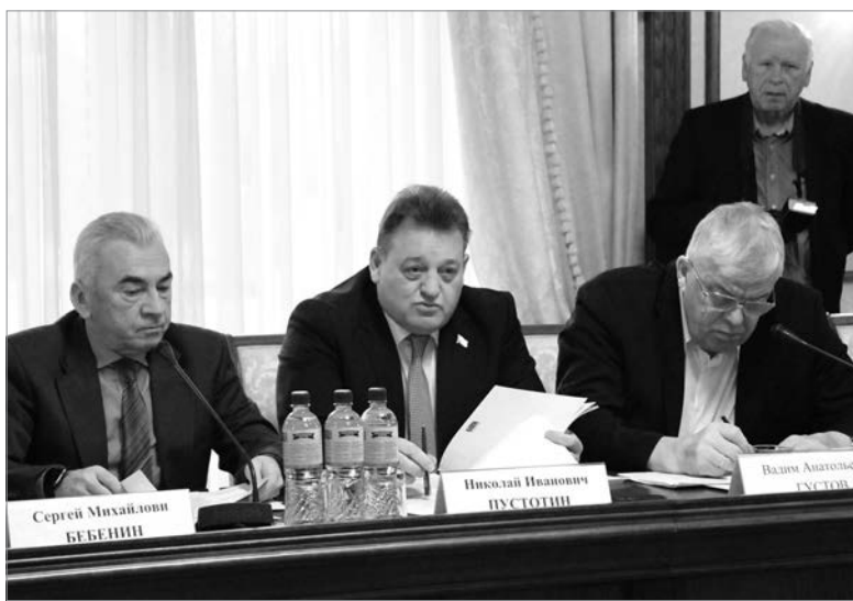
На встрече с журналистами областных СМИ в Законодательном собрании Ленобласти.

сдвигается в лучшую сторону, но, к сожалению, ни в Бокситогорске, ни в Пикалёве кадровый вопрос окончательно не решён.