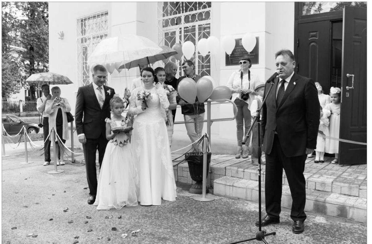
Открытие обновлённого ЗАГСА в Пикалёве.

Сегодня это не самая большая проблема для пикалёвской больницы, основная проблема — кадры. В таком ритме, на две ставки, год за годом просто физически работать невозможно. Область пытается помочь в решении этого вопроса, например, выделяет средства на покупку квартир для молодых специалистов. Ситуация