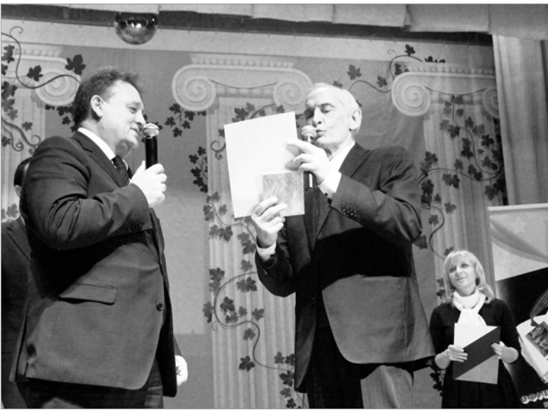
Встреча с народным артистом СССР Василием Лановым, г. Пикалёво.

Мы исходили из того, что не все депутаты сегодня загружены в полном объёме, и не все депутаты активно работают в своих избирательных округах.