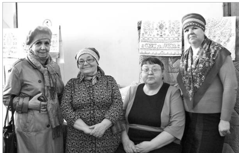
Пикалевские мастера на православной ярмарке в Тихвине