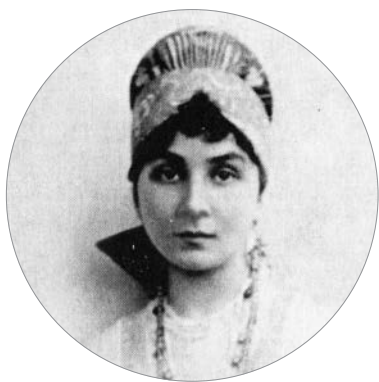
Анна Васильевна Тимирева