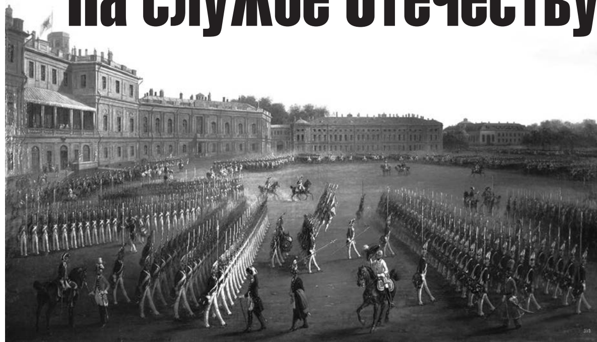
Император Павел I на параде войск в Гатчине.