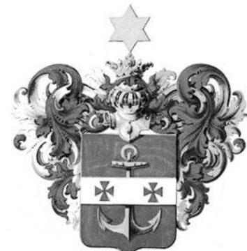
Герб рода Салтановых

Как указано в статье, генерал И.Д. Мамаев предполагал устроить ещё один придел во втором этаже трапезной, которую предполагалось надстроить, но этот замысел так и остался неосуществлённым. К этому времени у генерала созрели другие планы, и находился он за сотни вёрст от Кекинского прихода в Суглицком погосте Устюженского уезда Новгородской области.