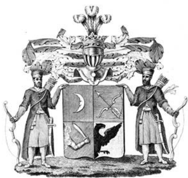
Герб рода Мамаевых

С территорией современного Бокситогорского района в прошлом связаны судьбы некоторых генералов и адмиралов Российской императорской армии и флота. Одни из них родились на данной земле, другие нашли на ней своё последнее пристанище, третьи имели в крае потомственные усадьбы и имения.