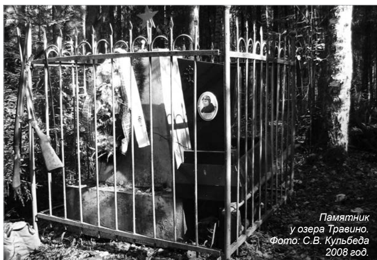
Памятник у озера Травино. 2008 год.

Зарплата бюджетников 47-го региона вырастет с 1 января