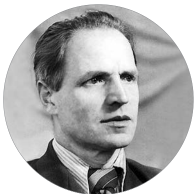
Советский художник Д.Ф. Филиппов.

Наш край является малой родиной нескольких мастеров изобразительного искусства. Здесь они родились, получили первые впечатления от окружающей действительности. И в этом мире они оставили заметный след благодаря своим незаурядным художественным способностям.