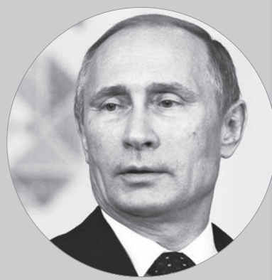
Из послания Президента Федеральному собранию 3 декабря 2015 года.

Закон должен быть суров к тем, кто сознательно пошёл на тяжкое преступление, нанёс ущерб жизни людей, интересам общества и государства.