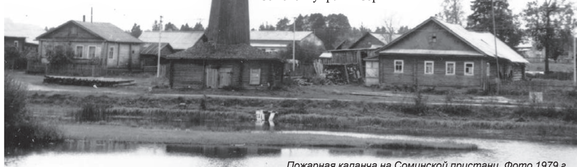
Пожарная каланча на Соминской пристани. Фото 1979 г.