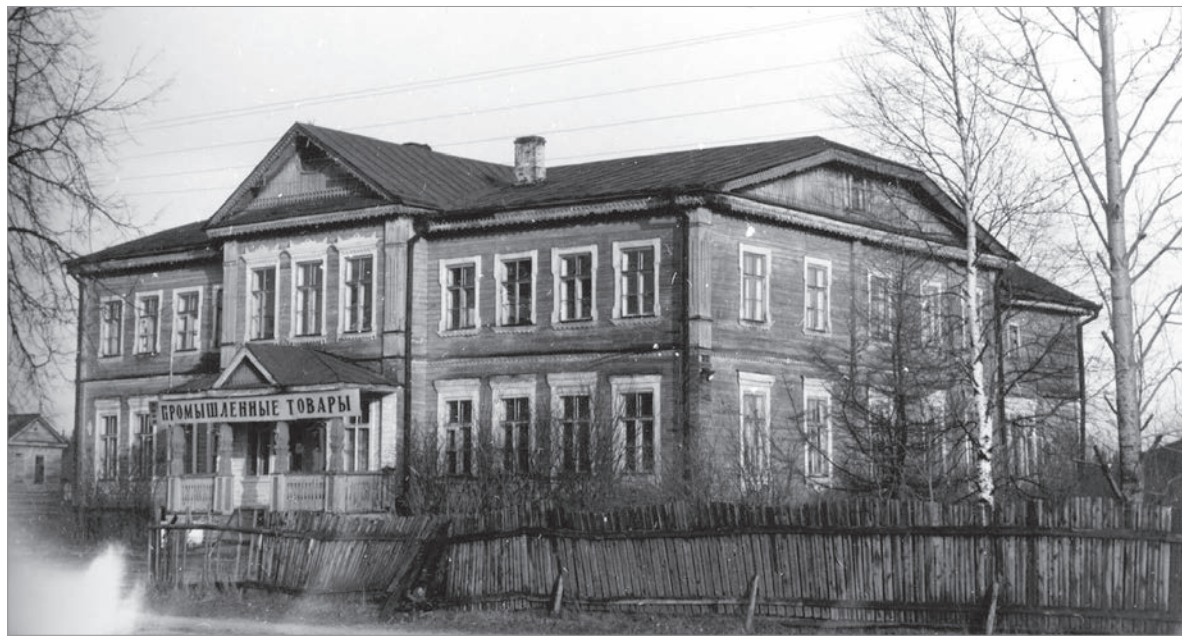
Купеческий дом в Сомино. Фото 1979 г.

зов Тихвинской водной системы. В них в 1910 году проживало 7 692 человека.