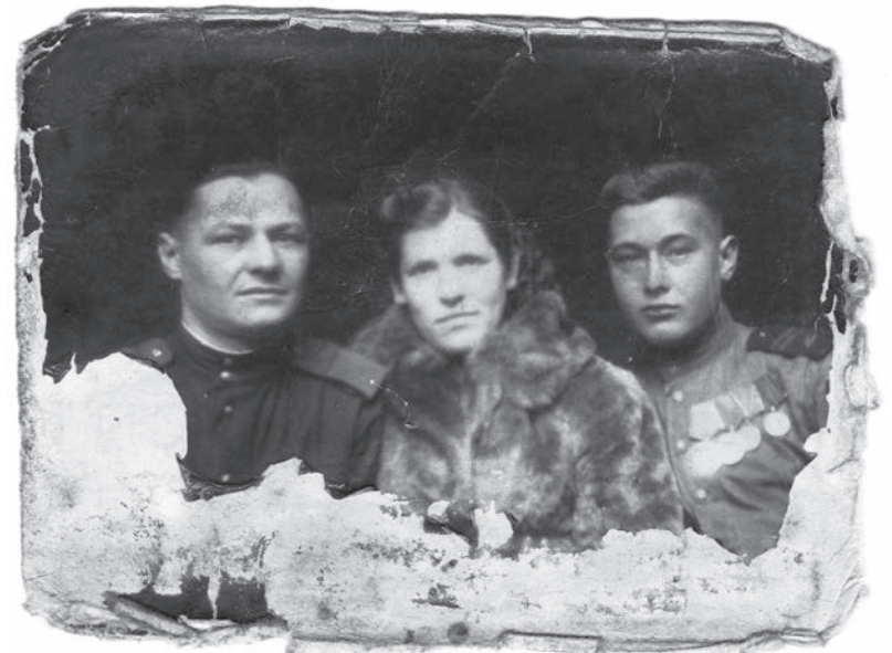
Михаил Петрович Кутузов (справа)