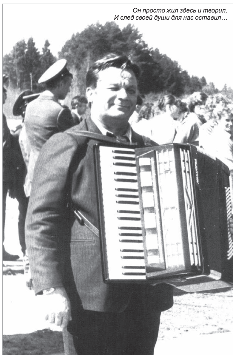
Он просто жил здесь и творил, И след своей души для нас оставил...