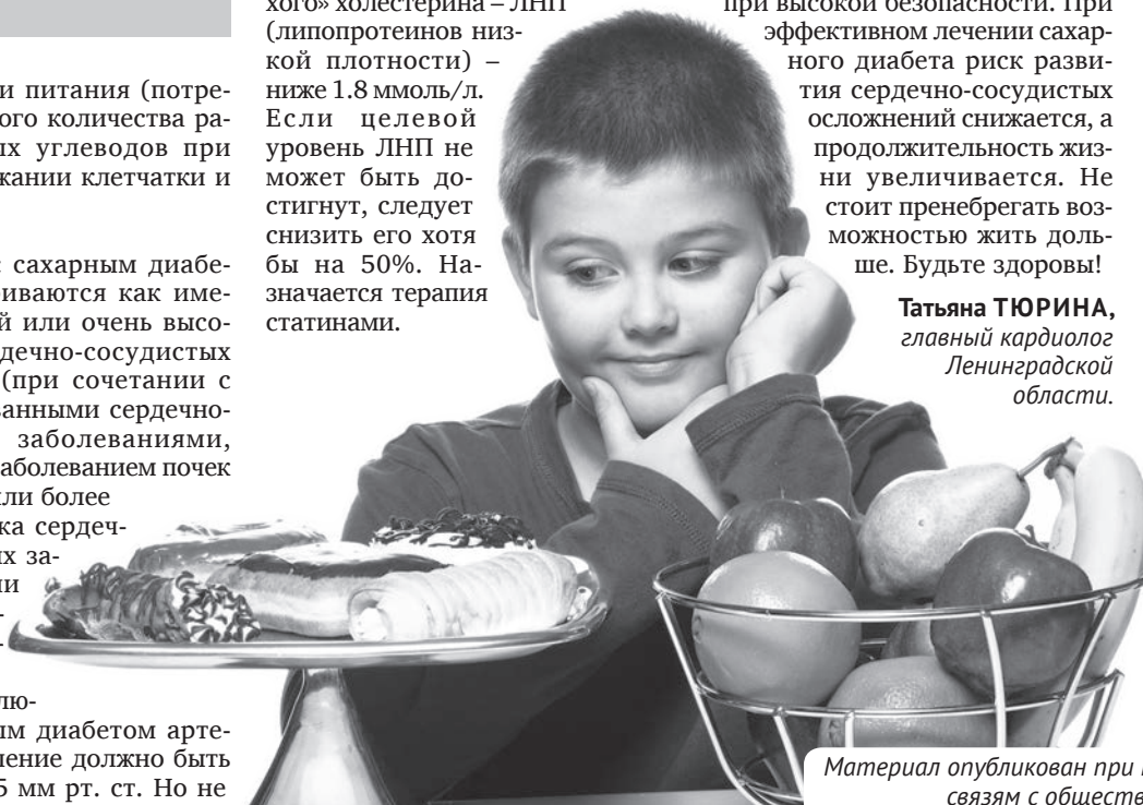
Материал опубликован при поддержке комитета по печати и связям с общественностью Ленинградской области.

Татьяна ТЮРИНА, главный кардиолог Ленинградской области.