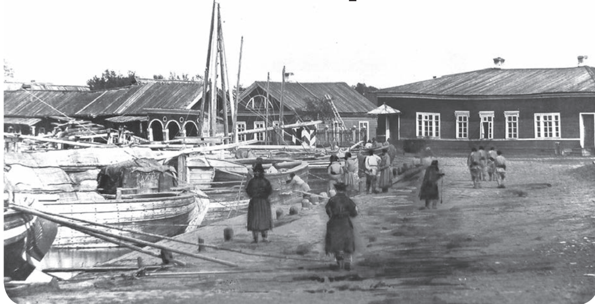
Дом начальника дистанции на Соминской пристани. Фото 1865 года.