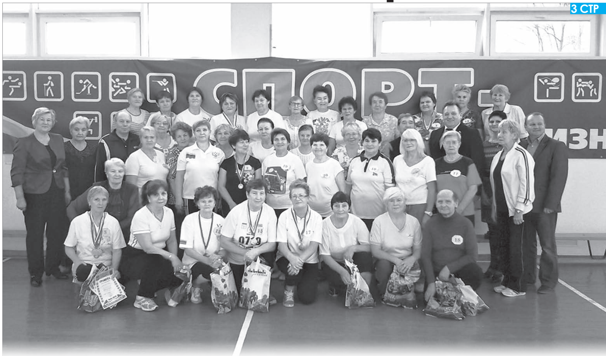
В игровом зале физкультурно-оздоровительного комплекса г. Пикалево 30 октября прошёл фестиваль спорта ветеранов войны и труда «ГТО – залог здоровья». В фестивале принимали участие наиболее активные представители спортивной общественности Совета ветеранов войны, труда и правоохранительных органов, Клуба пожилого человека, клубов «Будь здоров» и «Надежда» г. Пикалево.