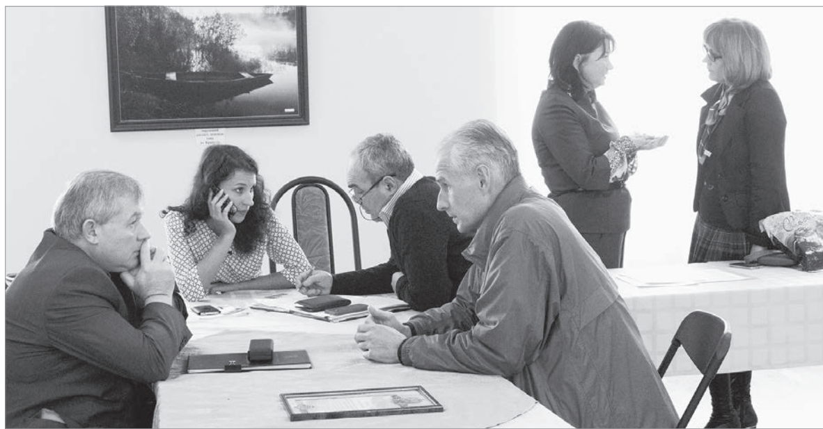
Председатель комитета по развитию малого, среднего бизнеса и потребительского рынка Ленинградской области Сергей Есипов выслушал проблемы предпринимателей Бокситогорского района.

что в настоящее время одной из важнейших предпосылок подъёма экономики России является стабилизация и рост производства во всех отраслях, но прежде всего – в перерабатывающей промышленности. Однако в Бокситогорском районе предприятий такого направления не так уж много, и во многом это связано с тем, что оборудование и техника стоят дорого, и не каждый предприниматель может себе позволить такую покупку. Кроме того, несмотря на многочисленные меры поддержки, малый бизнес в этой сфере испытывает немало проблем, и участники встречи знают о них не понаслышке. Предприниматели под-