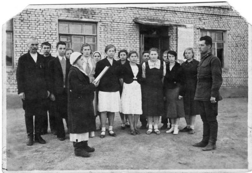
Принятие присяги. Авиамастерские №261. ВОВ

Перед нами редчайшая фотография от 3 августа 1942 года, пришедшая по почте в Зиновью Гору: