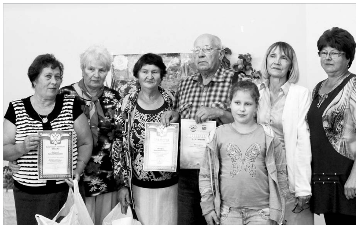
Пикалёвцы – участники районного конкурса «Ветеранское подворье»

кономерно все отмечали, что участие в таких конкурсах даёт дополнительный заряд энергии. Конкурс «Ветеранское подворье» – это открытое пространство для общения с единомышленниками, встреч с интересными людьми – настоящими энтузиастами своего дела.