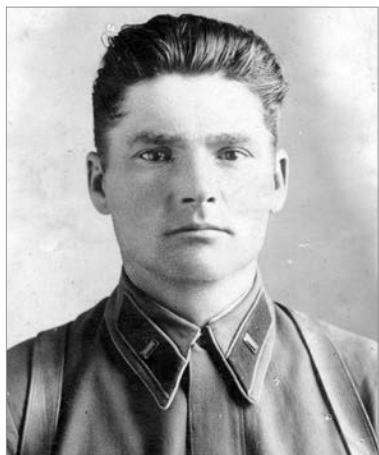
Александр Соколов. 1944 г.