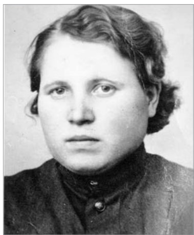
Ольга Бугина. 1944 г.