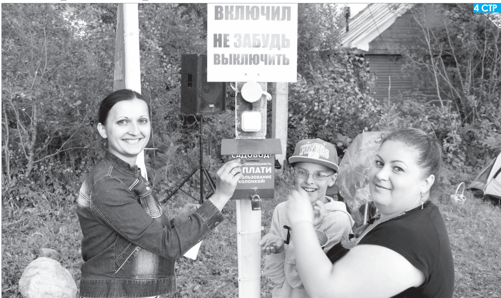
Третий год в конце июля в садоводстве «Металлург-2» (Шибково) собираются пикалёвские садоводы, чтобы подвести итоги, наметить перспективы, поделиться опытом. За эти годы мероприятие превратилось в народный праздник со своими традициями и особенностями.