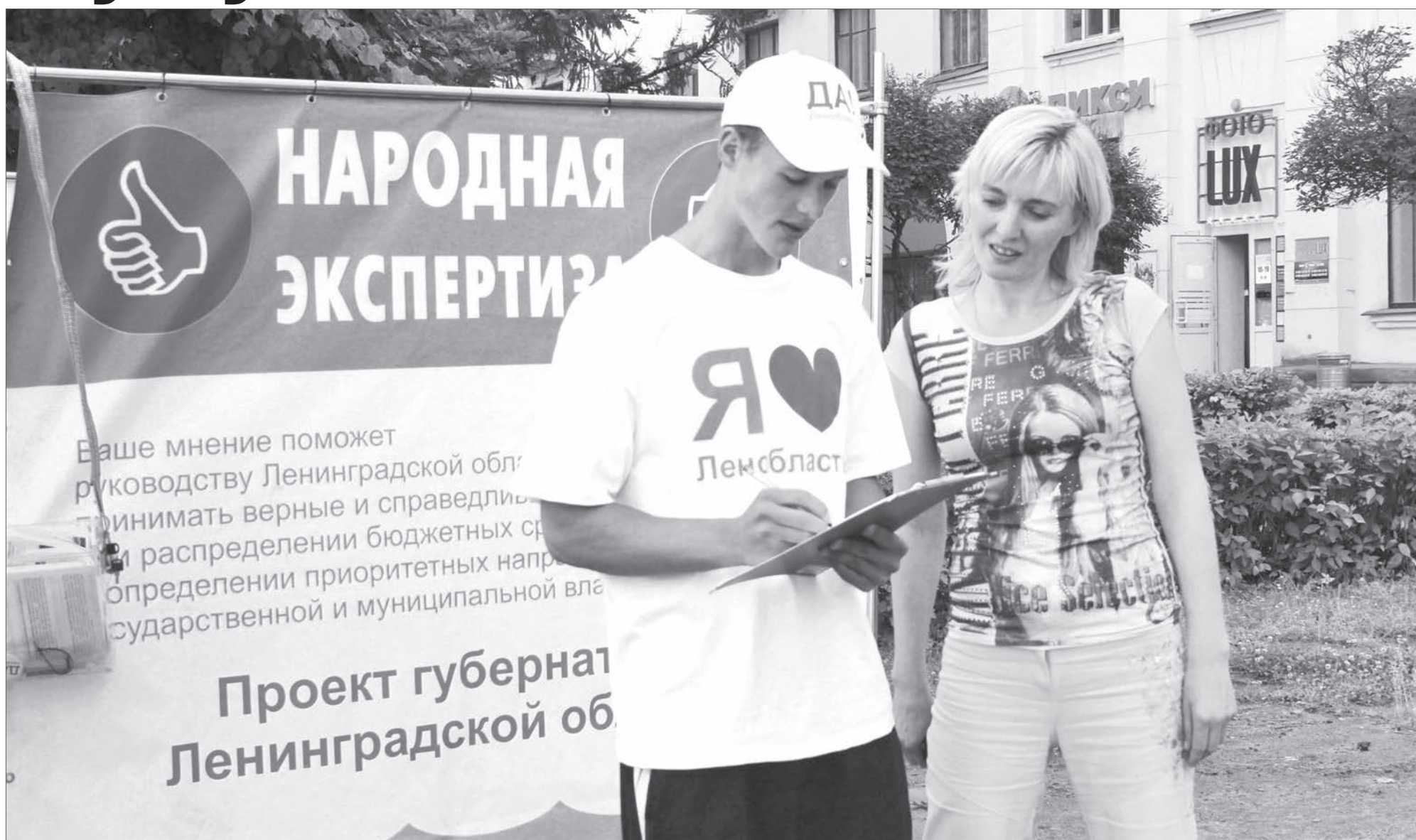
Пикеты в рамках проекта «Народной экспертизы» работали в Пикалёве 21 и 22 июля. Каждый мог высказать своё мнение о насущных проблемах города, способах их решения. При разработке стратегии социально-экономического развития области будет учтено и мнение пикалёвцев.