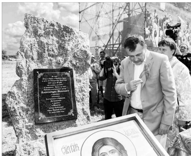
На торжестве в честь 775-летия победы русской дружины над шведами

Много веков спустя очередной западный завоеватель – Адольф Гитлер тоже стремился уничтожить наши духовные основы – оставшимся в живых немногим