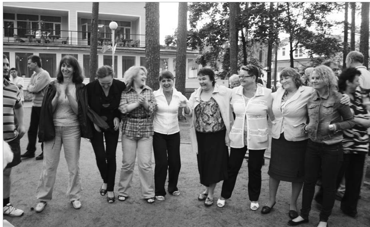
Как здорово, что все мы здесь сегодня собрались. На XVI фестивале СМЛ. Июль 2012 г.