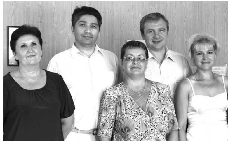
Коллектив редакции с главой администрации МО «Город Пикалёво» Сергеем Вебером и депутатом Госдумы Сергеем Петровым. Июль 2010 г.