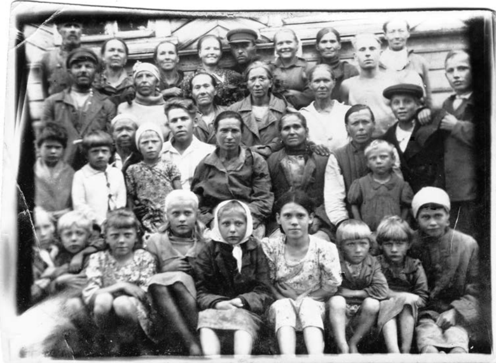
Жители д. Зиновья Гора (военные годы)