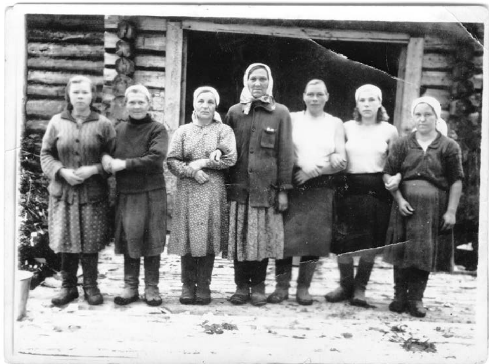
Работницы колхоза «Красная звезда». д. Володино