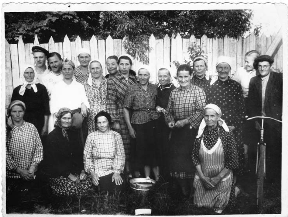
Жители Новой Деревни (послевоенные годы)