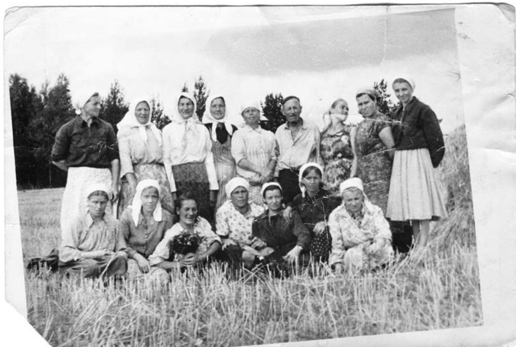
Работницы колхоза «Красная поляна». д. Озерово. 1946 г.