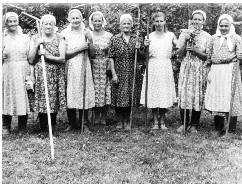
Колхоз «Красная новь», д. Окулово. Лето 1964 г.