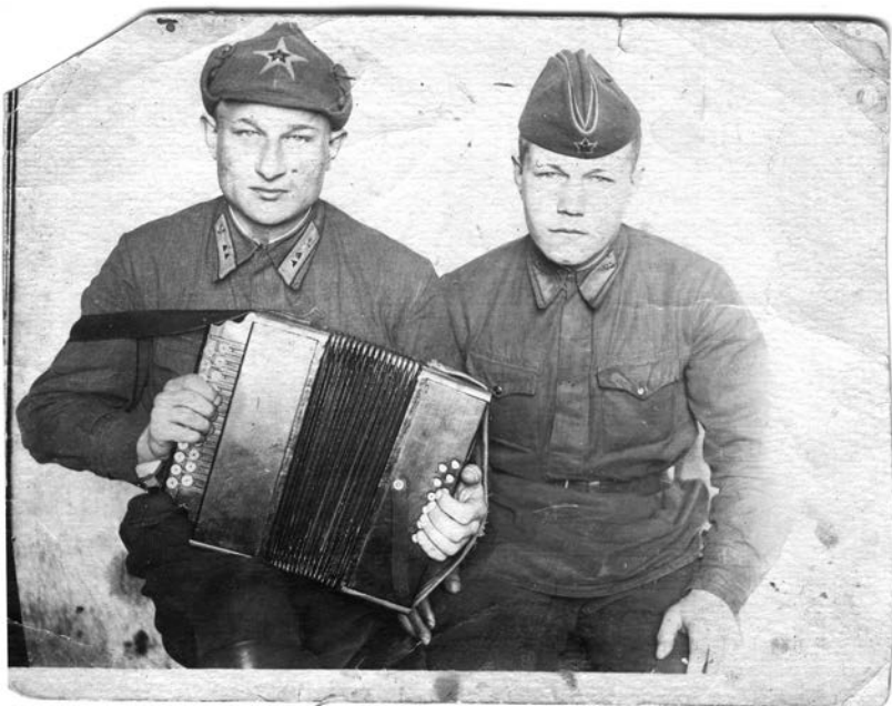
Александр Зиновьев (слева). 1941 г.