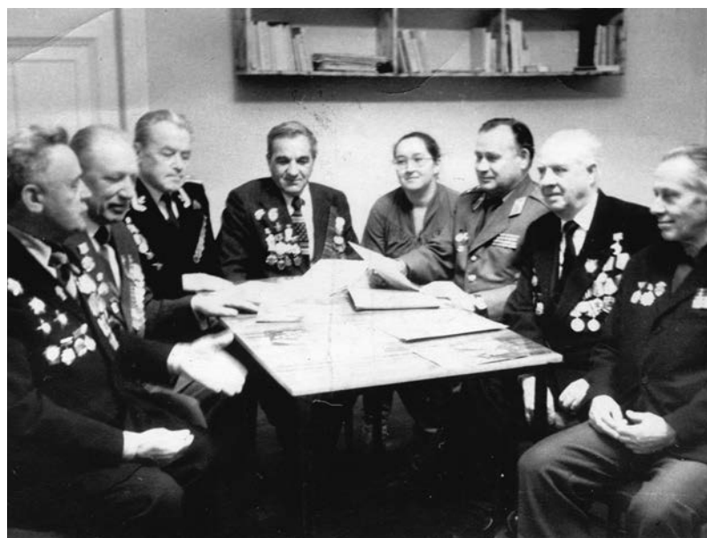
Клуб ветеранов «Победитель» ДК г. Пикалёво. 1990 г.