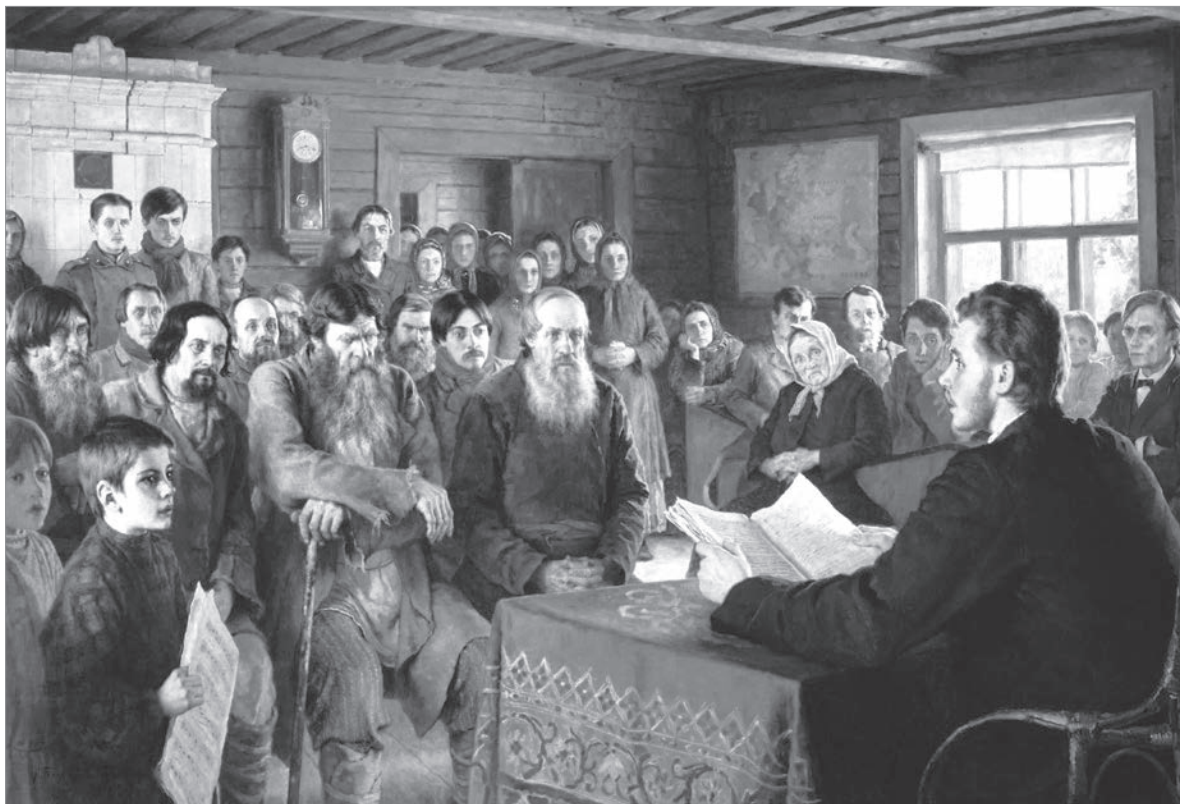
Н.П. Богданов-Бельский «Воскресное чтение в сельской школе». 1895 г.

Чтение как основная форма общения людей посредством печатных или рукописных текстов получило широкое распространение в нашем крае лишь во второй половине XIX века. Из воспоминаний Н.А. Качалова, который провёл своё детство в имении Пелуши, в старые времена (первая половина XIX века) в Тихвинском и Устюженском уездах, на территории которых располагался современный Бокситогорский район, собрания книг и журналов у населения были большой редкостью.