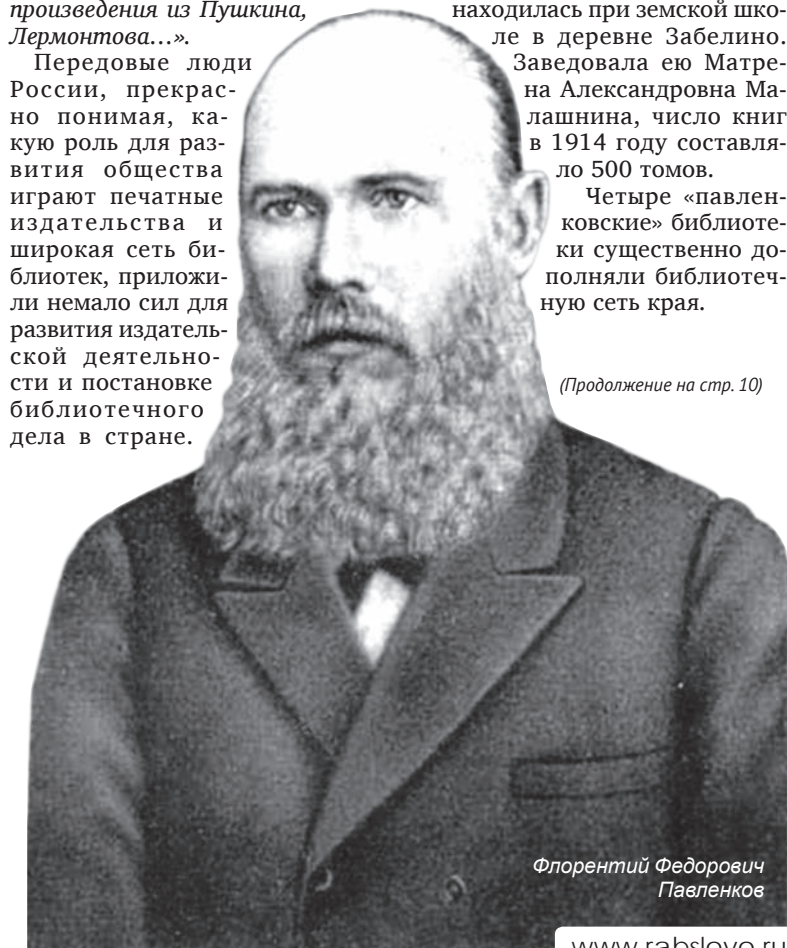
Флорентий Федорович Павленков