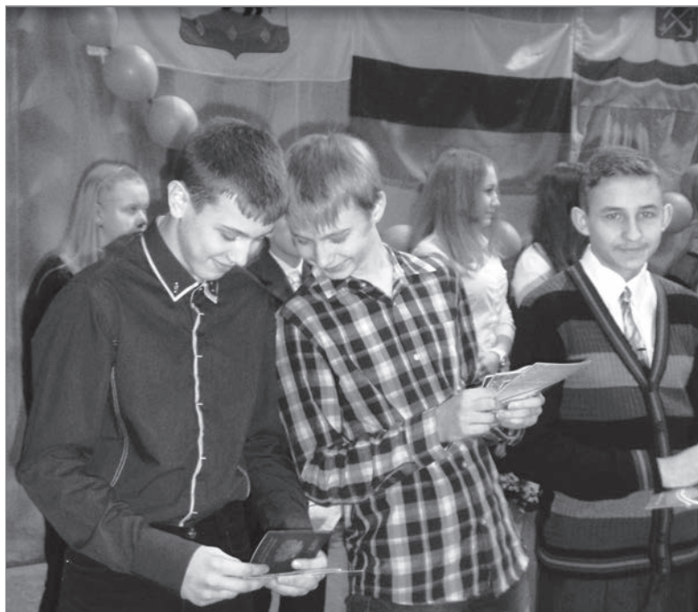
В городе Пикалёво на базе Бокситогорского центра дополнительного образования детей администрация Бокситогорского района, отдел УФМС России по Санкт-Петербургу и Ленинградской области при участии территориальной избирательной комиссии Бокситогорского муниципального района 5 марта провели торжественное вручение паспортов гражданина Российской Федерации.