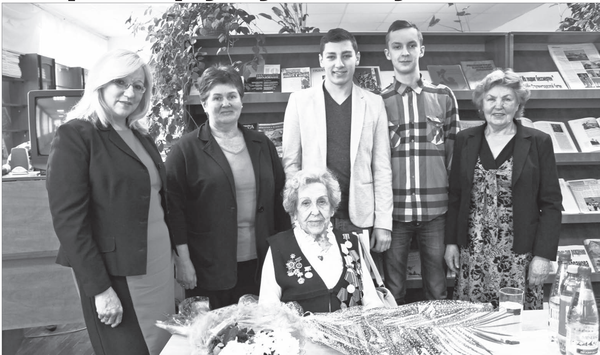
Накануне Международного женского дня студенты и преподаватели педагогического колледжа встретились с Зоей Ильиничной Штаповой. Нужно как можно чаще общаться с людьми, именами которых создаётся история государства. Это несомненно пойдёт на пользу сегодняшнему поколению.