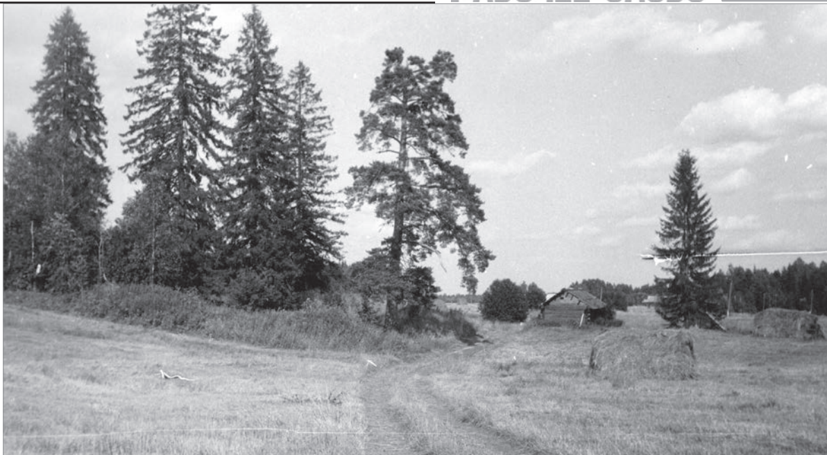
Деревня Дуброва. Фото 1970-х гг.