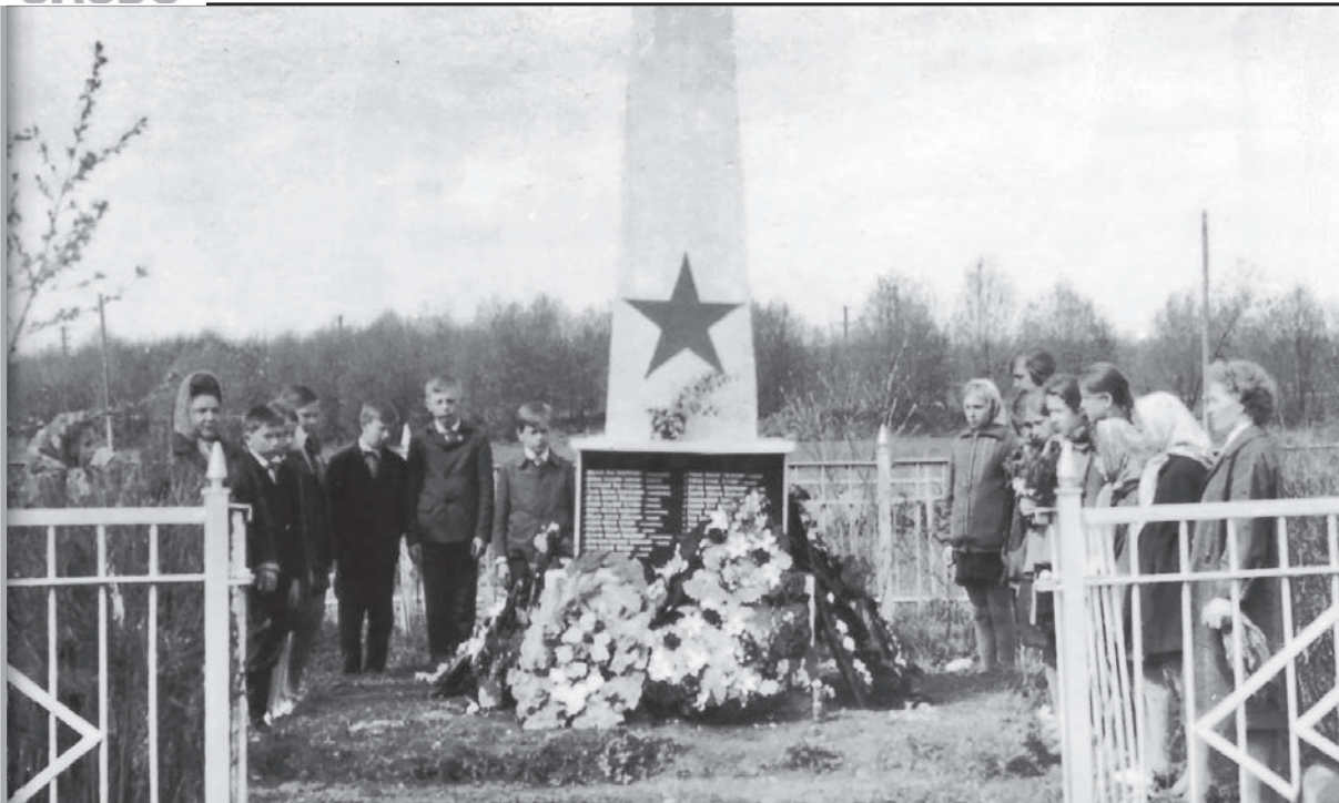
Учащиеся Новодеревенской школы у братской могилы в д. Зиновья Гора. Фото начала 1970-х г.г.