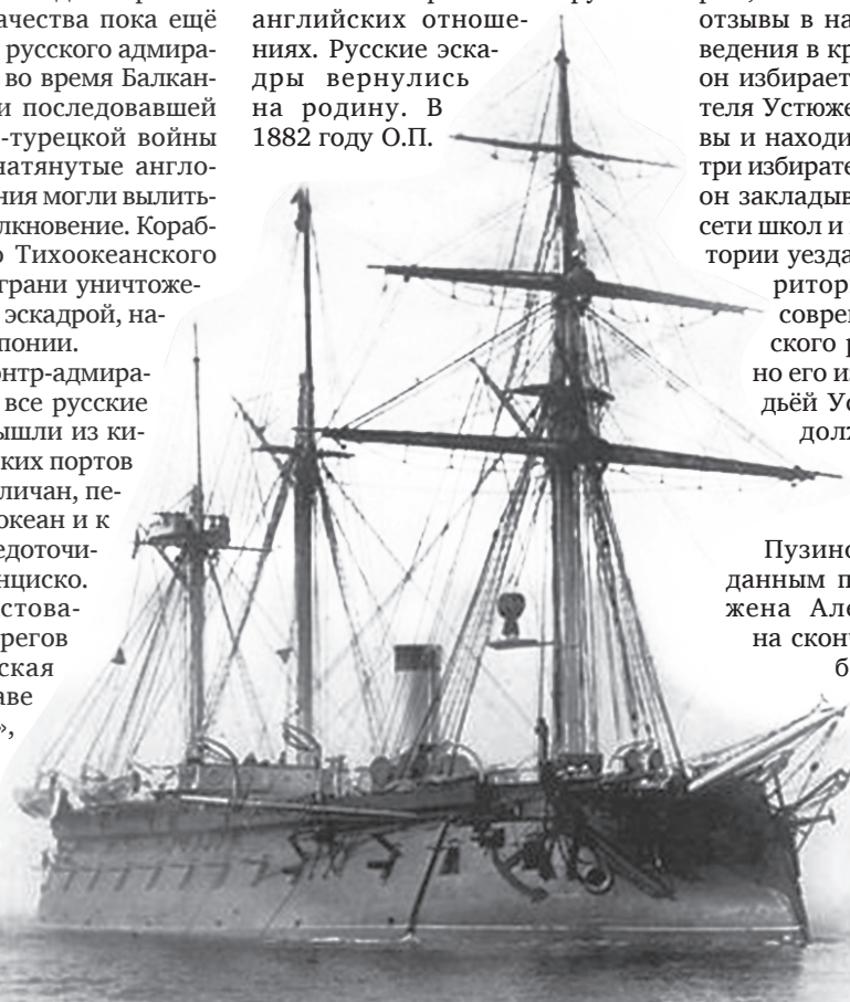
(Продолжение на стр.10)