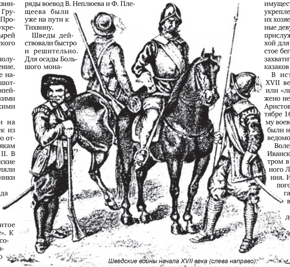
Шведские воины начала XVII века (слева направо): мушкетер, драугун, кирасир, пикинер