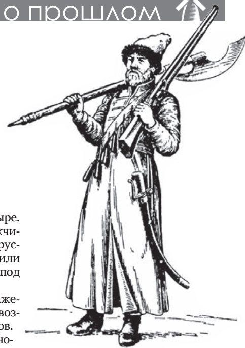
Московский стрелец XVII в.

После наступления холодов и установления санного пути «черкасы» стремительно бросились в поход на Русский Север. Под Холмогорами они потерпели поражение от местных воевод и, обо-