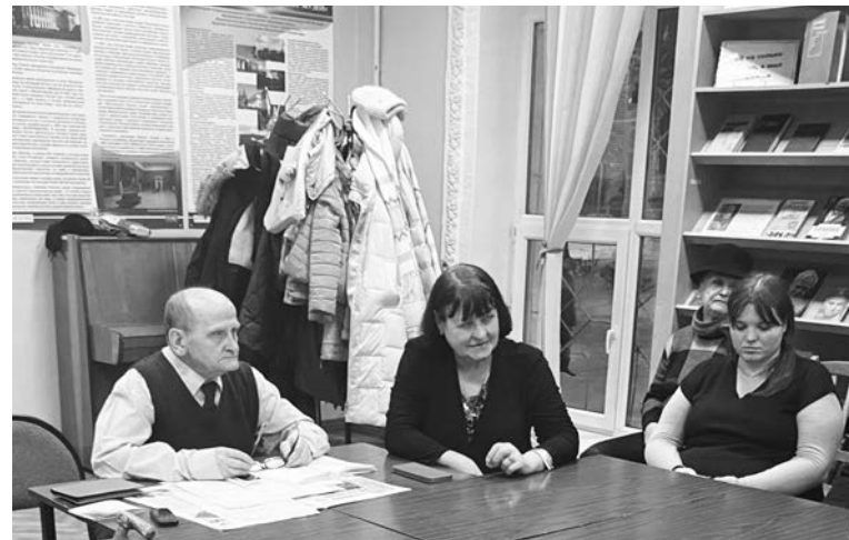
Занятия в Литературном клубе «Земляки» 19.02.2024 г.