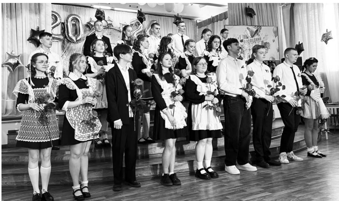
Фото и видео с «Последних звонков» вы можете найти в нашей группе ВКонтакте «Газета «Рабочее слово» г.Пикалево».

Мы верим в вас и знаем, что вы сможете достичь любых целей. Желаем вам успехов в учёбе, интересных открытий и незабываемых приключений. Пусть ваша жизнь будет наполнена яркими красками и счастливыми моментами! В добрый путь!