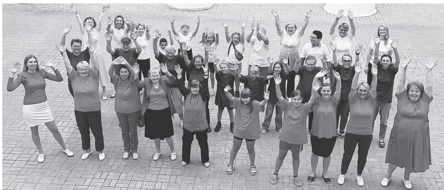
В городе Пикалёво прошла акция «Живой флаг», в честь Дня Государственного флага России. Жители города Пикалёво надели футболки белого, синего и красного цветов. Далее на площади Комсомола выстроились в триколор и поздравили всех с праздником!